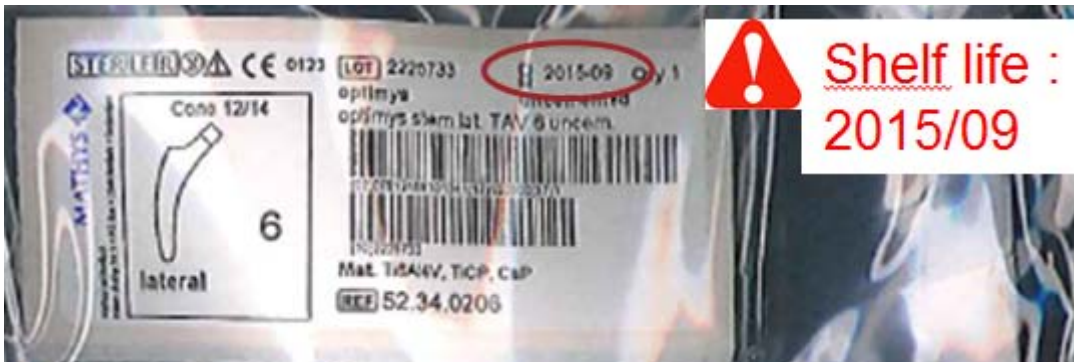
Afbeelding 1: voorbeeld van het onjuiste patiëntenetiket in de verpakking