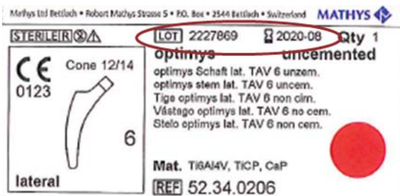
Afbeelding 2: voorbeeld van het juiste etiket op de kartonnen doos